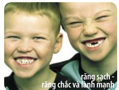
răng sạch - răng chắc và lành mạnh

bị vẩu. Thường thì răng bắt đầu tự hoàn thiện nếu trẻ bỏ bú tay hoặc dùng núm vú giả trước ba tuổi. Giúp trẻ bỏ được thói quen mút tay sẽ là rất khó khăn, do đó nên tìm đến sự trợ giúp của nha sĩ khi cần thiết.