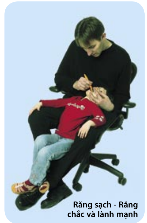
Răng sạch - Răng chắc và lành mạnh

Bạn cũng nên dùng chỉ tơ nha khoa (dùng được cả cho trẻ con lẫn người lớn) để làm sạch những chỗ ở cổ răng, kẽ răng, mà bàn chải đánh răng không đánh tới được. Tốt nhất là bắt đầu sử dụng chỉ nha khoa khi những chiếc răng đã mọc sát vào nhau.