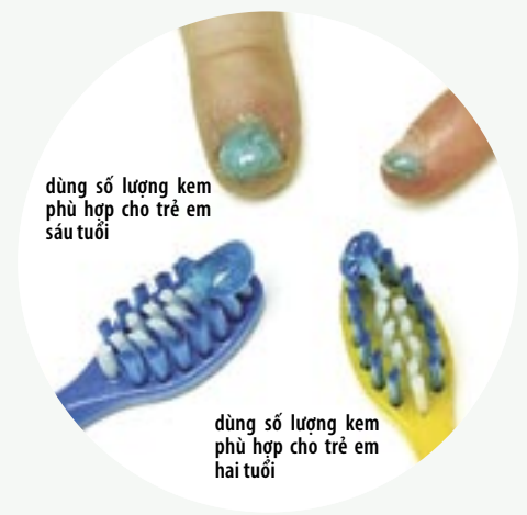
dùng số lượng kem phù hợp cho trẻ em sáu tuổi

lượng và cách dùng cho đúng. Trẻ từ sáu đến mười lăm tuổi đang trong thời kỳ thay răng, cũng cần được bổ sung thêm hàm lượng fluor bằng cách súc miệng hay tráng một lớp fluorit lên răng như một lớp men. Ngoài ra nếu ăn uống không lành mạnh (ăn nhiều kẹo, đồ ngọt, uống nước ga, uống rượu, hút thuốc lá) cũng là lý do phải cần bổ sung thêm fluor để bảo vệ răng.