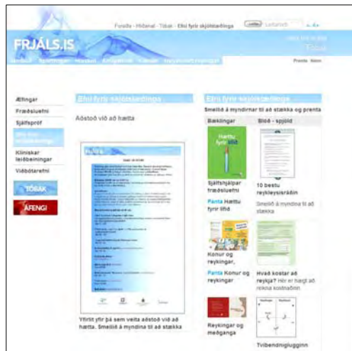
Á síðunni Efni fyrir skjólstaðinga er bent á gagnlegt efni og efni sem prenta má út