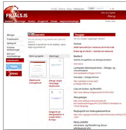
Á síðunni Viðbótarefni er ítarefni og tenglar