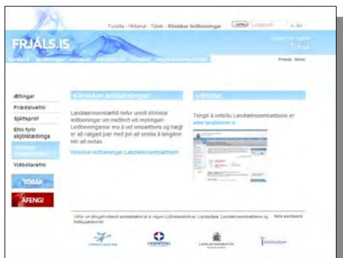
Klínískar leiðbeiningar er flýtleið í leiðbeiningar og vefsíðu Landlæknis