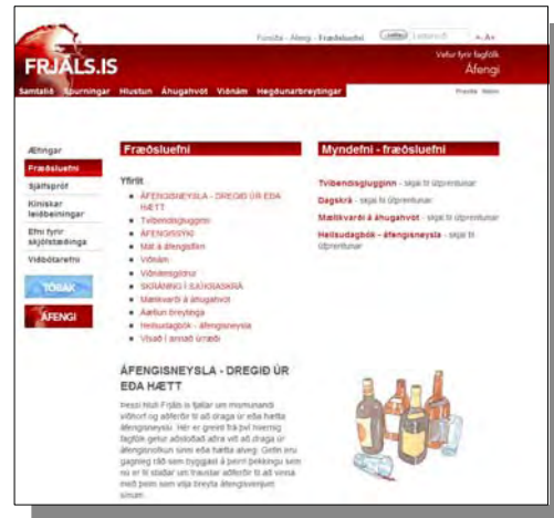
Aðalkennsluefnið er á síðunni Fræðsluefni

Klínískar leiðbeiningar er flýtleið í leiðbeiningar og vefsíðu Landlæknisembættisins.