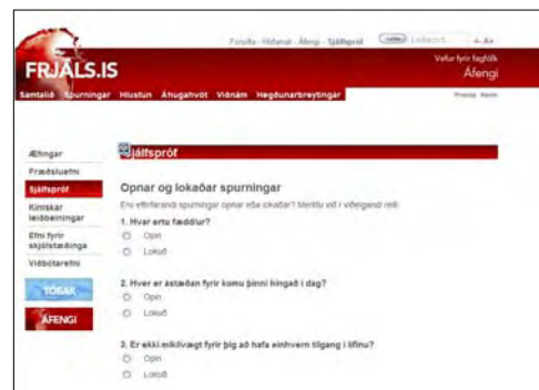
Sjálfspróf er gagnvirk síða þar sem hægt er að prófa þekkingu sína og fá viðbrögð